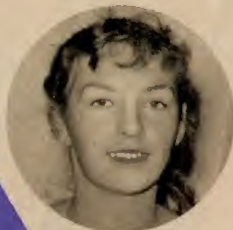
und 3. die auch bei uns bekannte Odile Versois

Es ist Frühling 1956. Von einem wolkenlosen Himmel lacht die Sonne. Beinahe sommerlich warm ist es in den Straßen von Paris. Das strahlende Wetter hat die Leute aus den Häusern gelockt. Rauschend flutet der Verkehr durch die schillernde Stadt an der Seine.